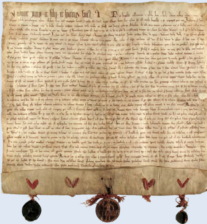
Akt lokacyjny miasta Krakowa, 1257 r.