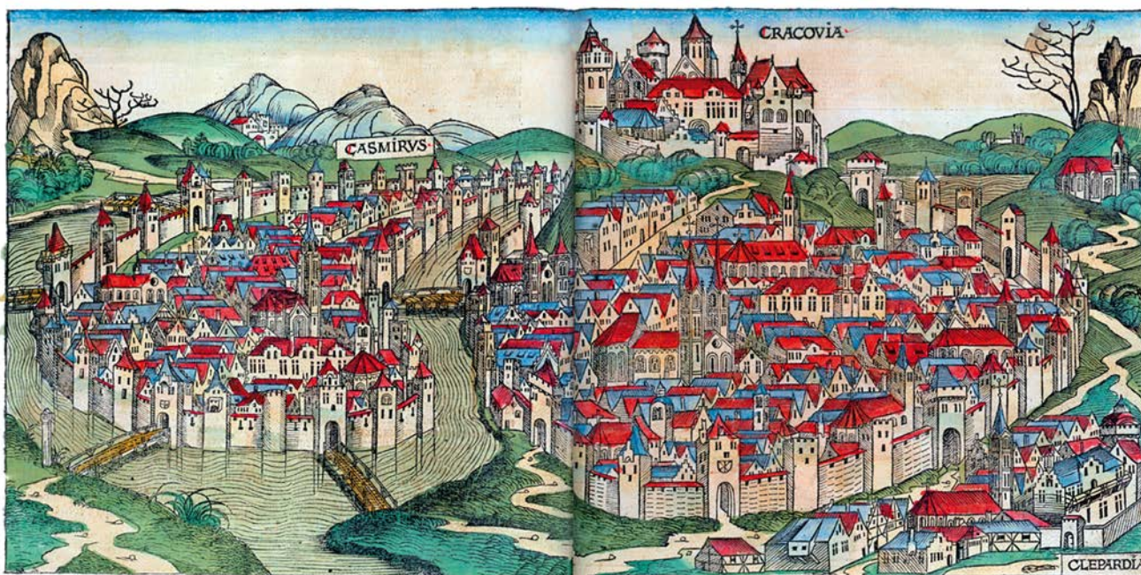
Widok Krakowa od strony północnej, najstarsze przedstawienie Krakowa, Norymberga 1493 r.

Po wschodniej stronie Sukiennic od XII wieku wznosił się kościół św. Wojciecha . Wzdłuż Sukiennic stały Kramy Bogate , gdzie sprzedawano towary luksusowe. Na południowym ich krańcu, pomiędzy Sukiennicami a kościołem św. Wojciecha znajdował się budynek Wielkiej Wagi , w którym ważono towary powyżej 1 cetnara (czyli około 63 kg). Tutaj odbywał się handel ołowiem, dlatego wagę nazywano też Ołowianą . Naprzeciwko wylotu ulicy Siennej stała Mała Waga , służąca do ważenia artykułów o ciężarze poniżej 1 cetnara, takich jak mydło, sadło, smoła, atun, żywica czy niezbędny do oświetlania воск. Ważono tu także towary luksusowe pochodzenia wschodniego.