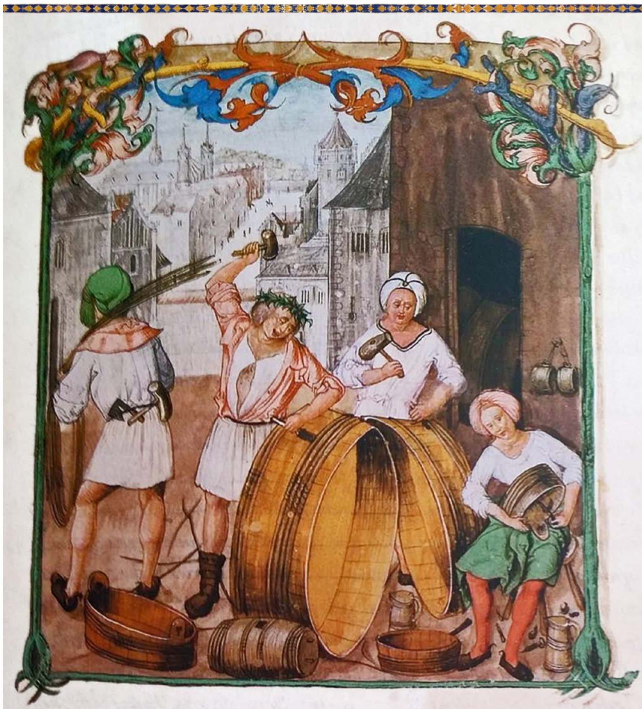
Bednarze, miniatura z Kodeksu Baltazara Behema, 1505 r.

W przedmioty codziennego użytku zaopatrywano się również w pracowniach rzemieślników. Sprzedaż zajmowała się najczęściej żona mistrza. Aby móc prowadzić swój warsztat rzemieślniczy, trzeba było mieć uprawnienia mistrza. Uczeń najpierw zdobywał umiejętności niezbędne do tego, by się stać czeladnikiem. A czeladnik dopiero po doskonałym wykonaniu specjalnej pracy – majstersztyku – otrzymywał tytuł mistrza. Rzemieślnicy wytwarzający te same przedmioty skupiali się w organizacjach nazywanych cechami. Dbały one o jakość towarów, broniły interesów swoich członków, do ich obowiązków należała także obrona miasta przed nieprzyjacielem.