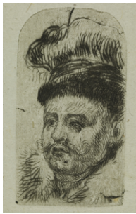
Jan Piotr Norblin, Głowa szlachcica w konfederatce, Polona

Kamienica Metrykantów Koronnych ul. Świętojańska 21