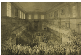
Jan Piotr Norblin, Zaprzysiężenie Konstytucji 3 Maja 1791

Monarchia dziedziczna – ustrój, w którym po śmierci władcy tron obejmuje jego potomek.