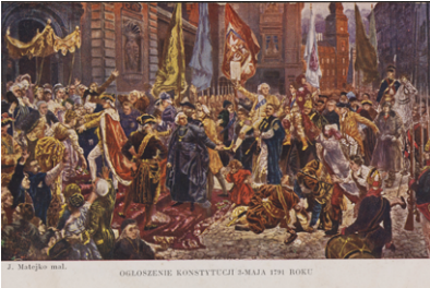
Jan Matejko, Uchwalenie Konstytucji 3 Maja 1791 roku, pocztówka

Obraz „Konstytucja 3 Maja 1791 roku” Jana Matejki można zobaczyć w Zamku Królewskim w Warszawie.