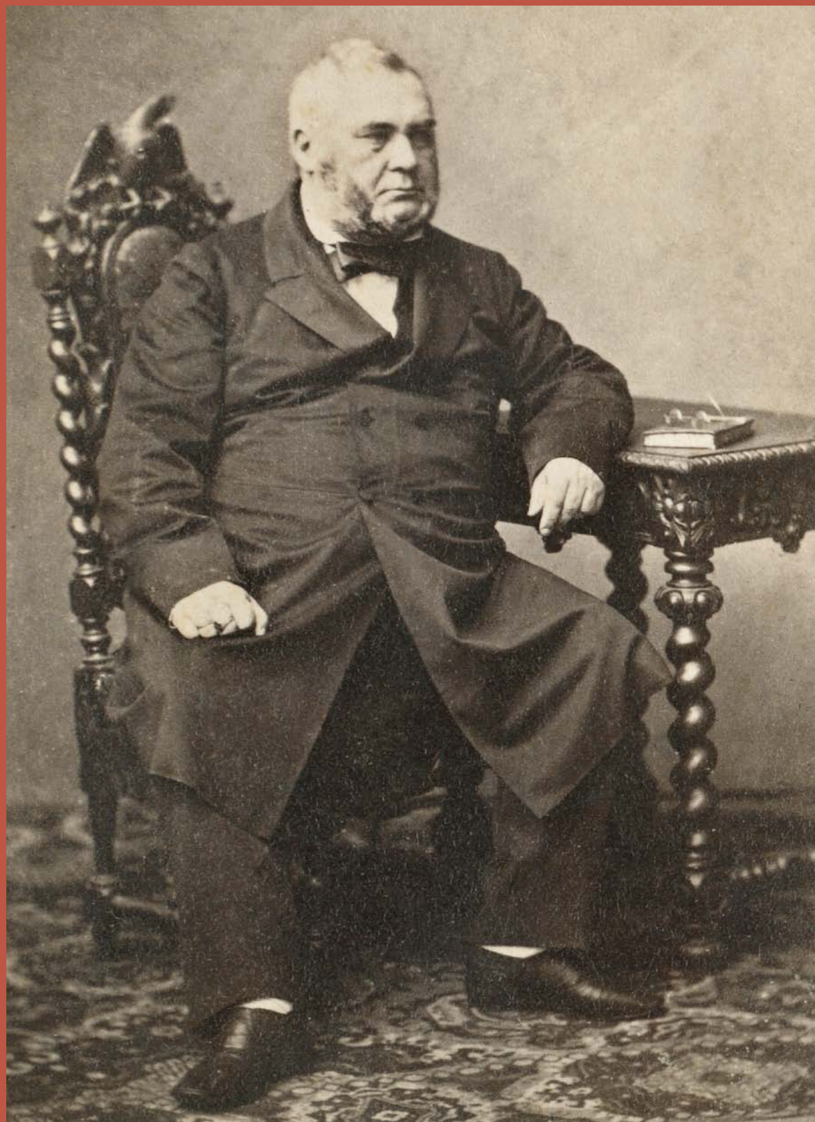
Hrabia Wielopolski margrabia Myszkowski.