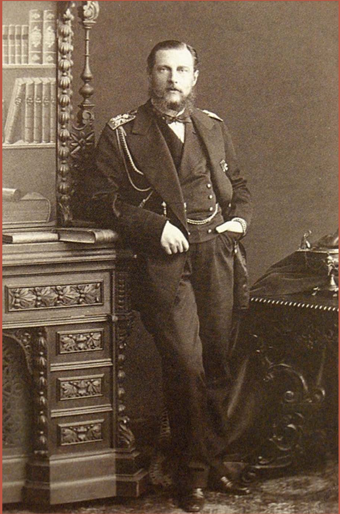
Autor nieznany. polona.pl