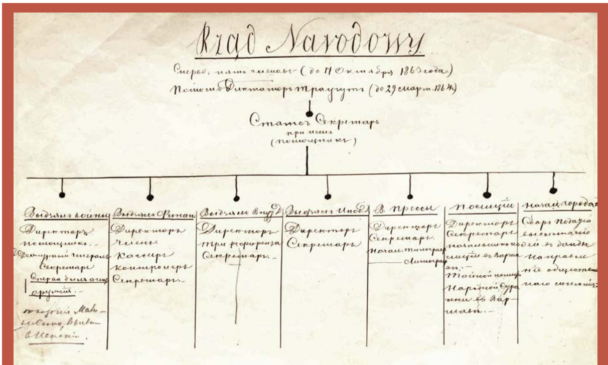
Schemat organizacyjny Rządu Narodowego i organizacja terenowych władz powstańczych.

W marcu 1863 r., Tymczasowy – jeszcze – Rząd Narodowy wydał regulamin wprowadzający podział administracyjny. Przywództwo województw, powiatów i miast objęli naczelnicy. Władze podzielono na dwa pionki: cywilny i wojskowy. Na Ziemiach Zabrzanych powołano do życia Wydział Zarządzający Prowincjami Litwy. Również tam przeprowadzono nowy podział terytorialny.