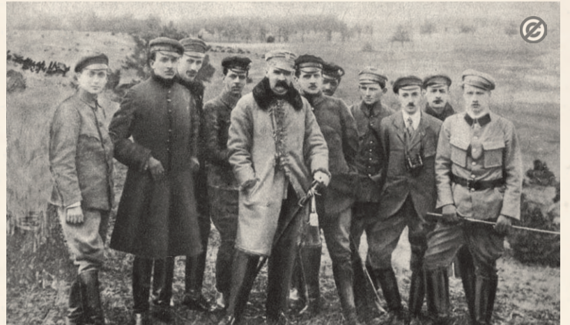
KOMENDA NACZELNA POW PODCZAS ĆWICZEŃ, 1917 R.

Jest rok 1917. Trwa I wojna światowa, Polski nie ma na mapie Europy od ponad stu lat. Polacy, żyjąc pod trzema zaborami, zmagają się z codziennymi problemami. Na polskich ziemiach tworzą się i działają organizacje, których celem jest zachowanie tożsamości narodowej i odzyskanie przez Polskę niepodległości. Polacy walczą w armiach zaborczych, ale tworzą też własne jednostki wojskowe. Na arenie międzynarodowej podejmowane są działania dyplomatyczne na rzecz Polski. Nasza jednodniówka przybliży ten czas. Zapraszamy do lektury.