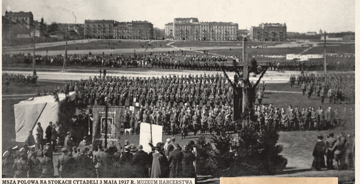
MSZA POLOWA NA STOKACH CYTADELI 3 MAJA 1917 R. MUZEUM HARCERSTWA