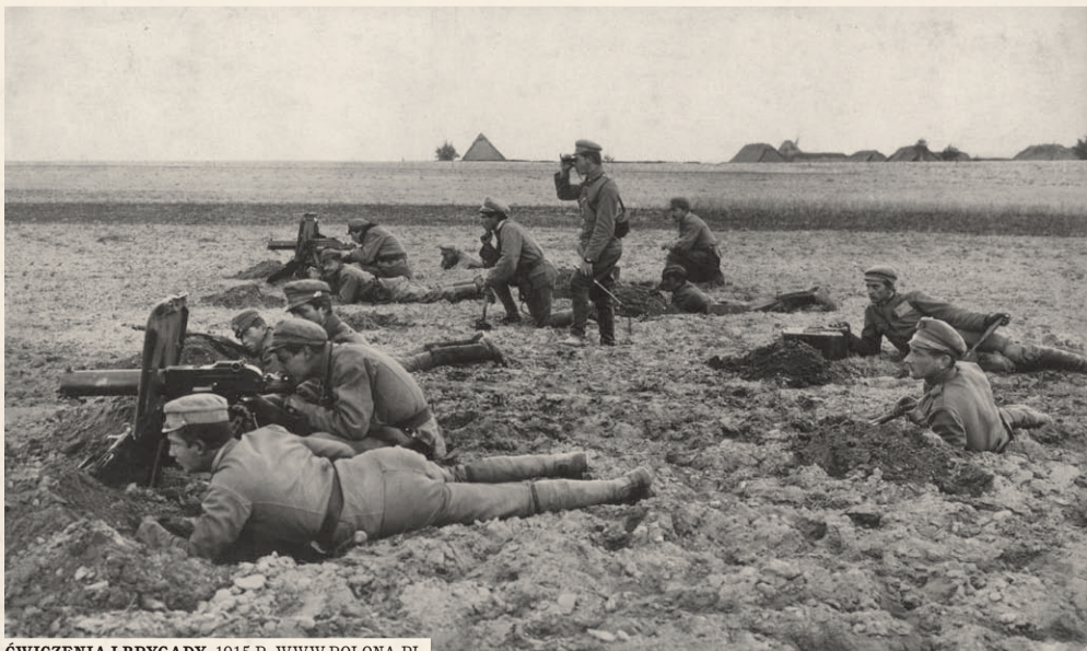
ĆWICZENIA I BRYGADY, 1915 R. WWW.POLONA.PL

Kolejną ważną datą w historii harcerstwa są dni 1-2 listopada 1918 roku, kiedy w Lublinie doszło do zjazdu zjednoczeniowego harcerstwa wszystkich zaborów. W 1918 roku polskie harcerstwo liczyło około 30 tys. członków. Po odzyskaniu niepodległości harcerze walczyli o granice odrodzonej ojczyzny w obronie Lwowa, w powstaniu wielkopolskim i w powstaniach śląskich, a także w wojnie polsko-bolszewickiej 1920 roku. (GSD)