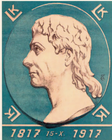
NALEPKA OKIENNA (22 X 17,5 CM) WYDANA W SETNĄ ROCZNICĄ ŚMIERCI KOŚCIUSZKI PRZEZ NACZELNY KOMITET NARODOWY. BIBLIOTEKA UNIWERSYTECKA W WARSZAWIE.