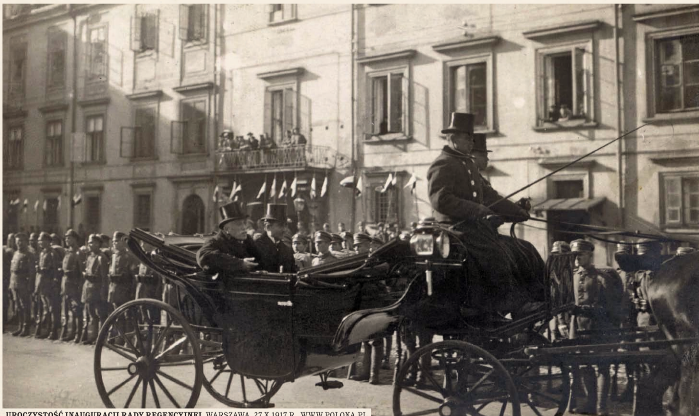
UROCZYSTOŚĆ INAUGURACJI RADY REGENCYJNEJ, WARSZAWA, 27 X 1917 R., WWW.POLONA.PL