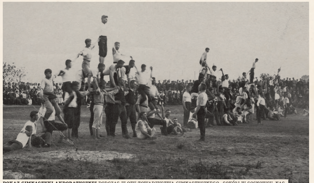
POKAZ GIMNASTYKI AKROBATYCZNEJ PODCZAS ZLOTU TOWARZYSTWA GIMNASTYCZNEGO „SOKÓŁ” W SOSNOWCU. NAC.