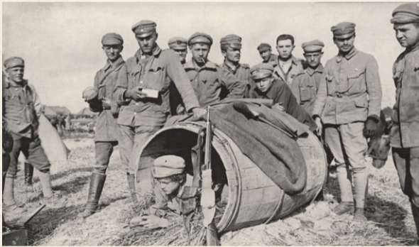
LEGIONIŚCI I BRYGADY W CZASIE WOLNYM OD ZAJĘĆ, 1915 R.

Latem 1916 r. protestując przeciwko lekceważeniu Legionów i nieuznawaniu ich za wojsko polskie walczące o niepodległość, do dymisji podał się Józef Piłsudski. We wrześniu 1916 r. Legiony przeformowano w Polski Korpus Posiłkowy. Po ogłoszeniu deklaracji państw centralnych w sprawie utworzenia niepodległego państwa polskiego na ziemiach zaboru rosyjskiego (Akt 5 listopada 1916 r.) oddziały legionowe przekazano pod dowództwo niemieckie. Część I i III Brygady odmówiła złożenia przysięgi. W wyniku kryzysu przysięgowego latem 1917 r. ponad 3 tys. żołnierzy internowano w obozach w Szczypiornie i Beniamimowie. Józef Piłsudski trafił do niemieckiego więzienia w Magdeburgu. II Brygada, której większość żołnierzy złożyła przysięgę, została przekazana pod dowództwo austriackie i jako Polski Korpus Posiłkowy skierowana na Ukrainę. W lutym 1918 r., na wieść o zawarciu przez państwa centralne separataystycznego pokoju z Rosją, część żołnierzy pod dowództwem płk. Józefa Hallera przedarła się przez linię frontu pod Rarańczą i połączyła z II Korpusem Polskim w Rosji. Polskie formacje zostały rozbite przez Niemców 11 maja 1918 r. w bitwie pod Kaniowem, a po rozbrojeniu żołnierzy internowano w Brześciu Litewskim. (BW)