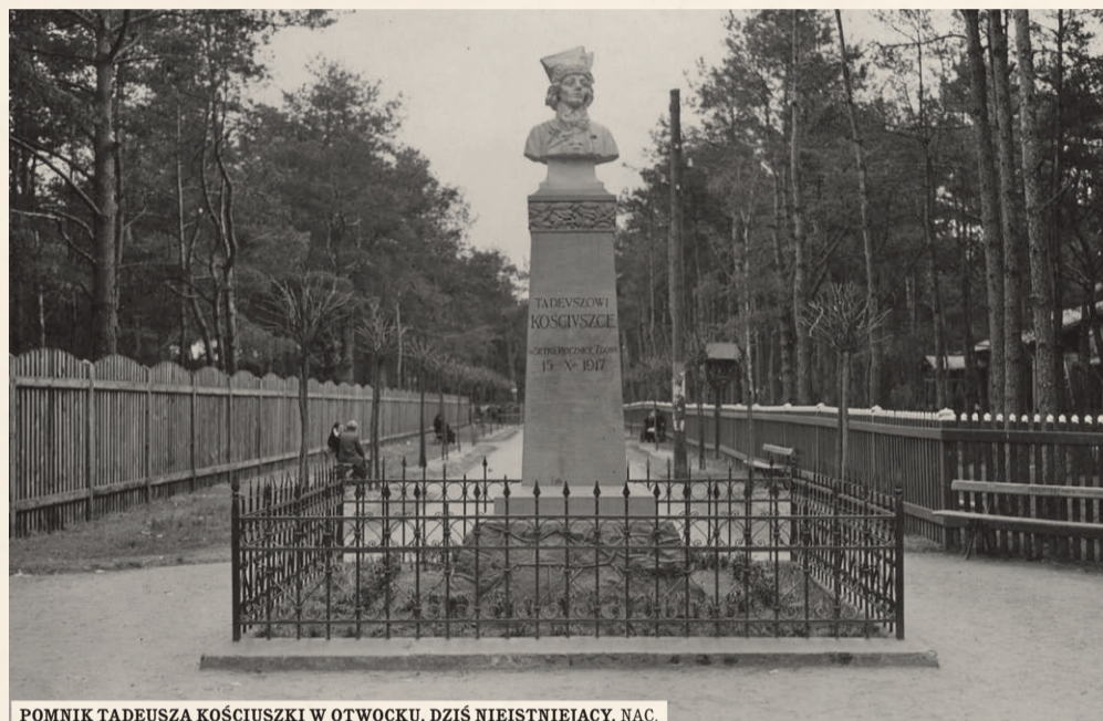
POMNIK TADEUSZA KOŚCIUSZKI W OTWOCKU, DZIŚ NIEISTNIEJĄCY.

Za pierwszy rząd niepodległej Polski KNP uznał gabinet Ignacego Paderewskiego. Po rozszerzeniu składu osobowego Komitet stał się oficjalnym przedstawicielstwem polskiego rządu na konferencję pokojową w Wersalu. Na jego czele stanął Roman Dmowski. (AJ)