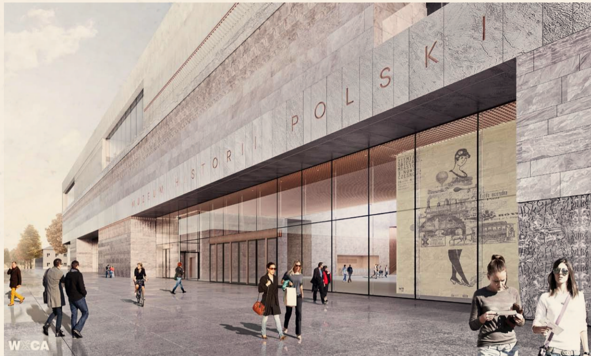
WIZUALIZACJA - WIDOK BUDYNKU MUZEUM HISTORII POLSKIEJ OD STRONY PLACU GWARDII (WEJŚCIE GŁÓWNE), PROJEKT PRACOWNI WXCA

Siedziba Muzeum Historii Polski powstanie na terenie Cytadeli Warszawskiej w zespole muzealnym, do którego należeć będą już istniejące Muzeum X Pawilonu, Muzeum Katyńskie oraz